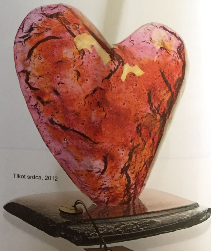
Tlkot srdca, 2012

Áno, sklo je môj život. Pracujem s ním každý deň a čím dôvernejšie ho poznám, tým je pre mňa tento materiál fascinujúcejší a záhadnejší. Viem, ako sa taví v peci, syčí, vzpiera sa, kým vydá svoj vonkajší a vnútorný tvar. Vo svojich dizajnerských dielach sa snažím spojiť dve veci: vysokú úžitkovosť a zároveň vložiť do nich pridanú hodnotu umenia, aby sa v tom odrážal môj rukopis, moje myslenie a najmä môj estetický cit.