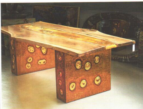
Stôl pohody, 2016