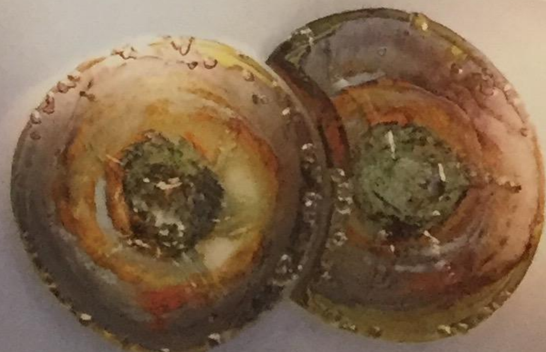
Mesiac a sinko, 2013