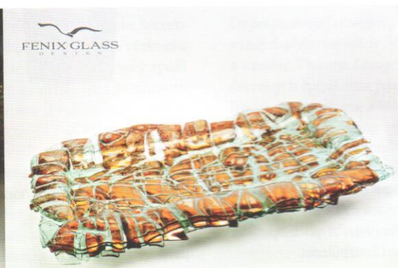
Diova misa, 2016