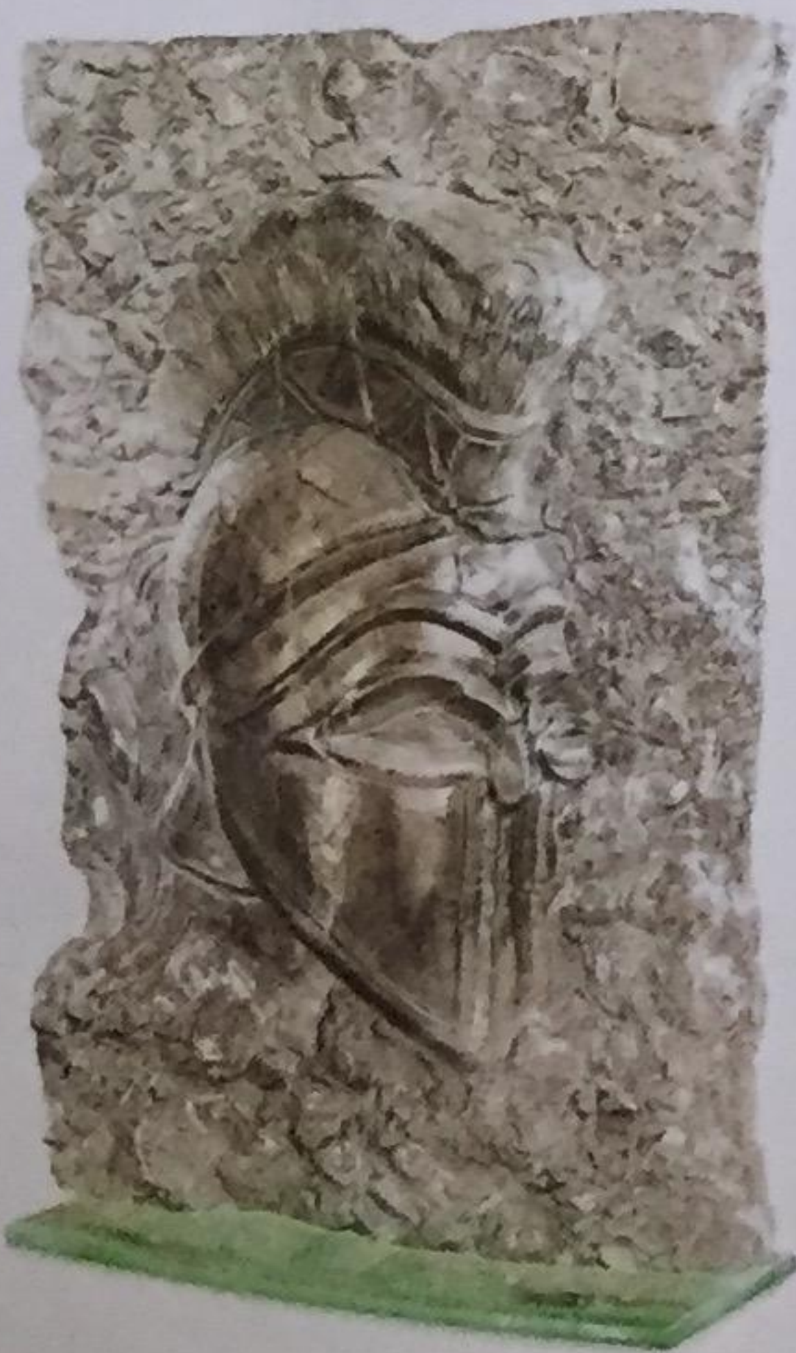
Antický bojovník, 2015

Sklo nie je iba povrch, hladkosť, kryštalickosť, priehľadnosť. Sklo je pre mňa niečo ako bájnny materiál, ktorý je schopný mnohokrát