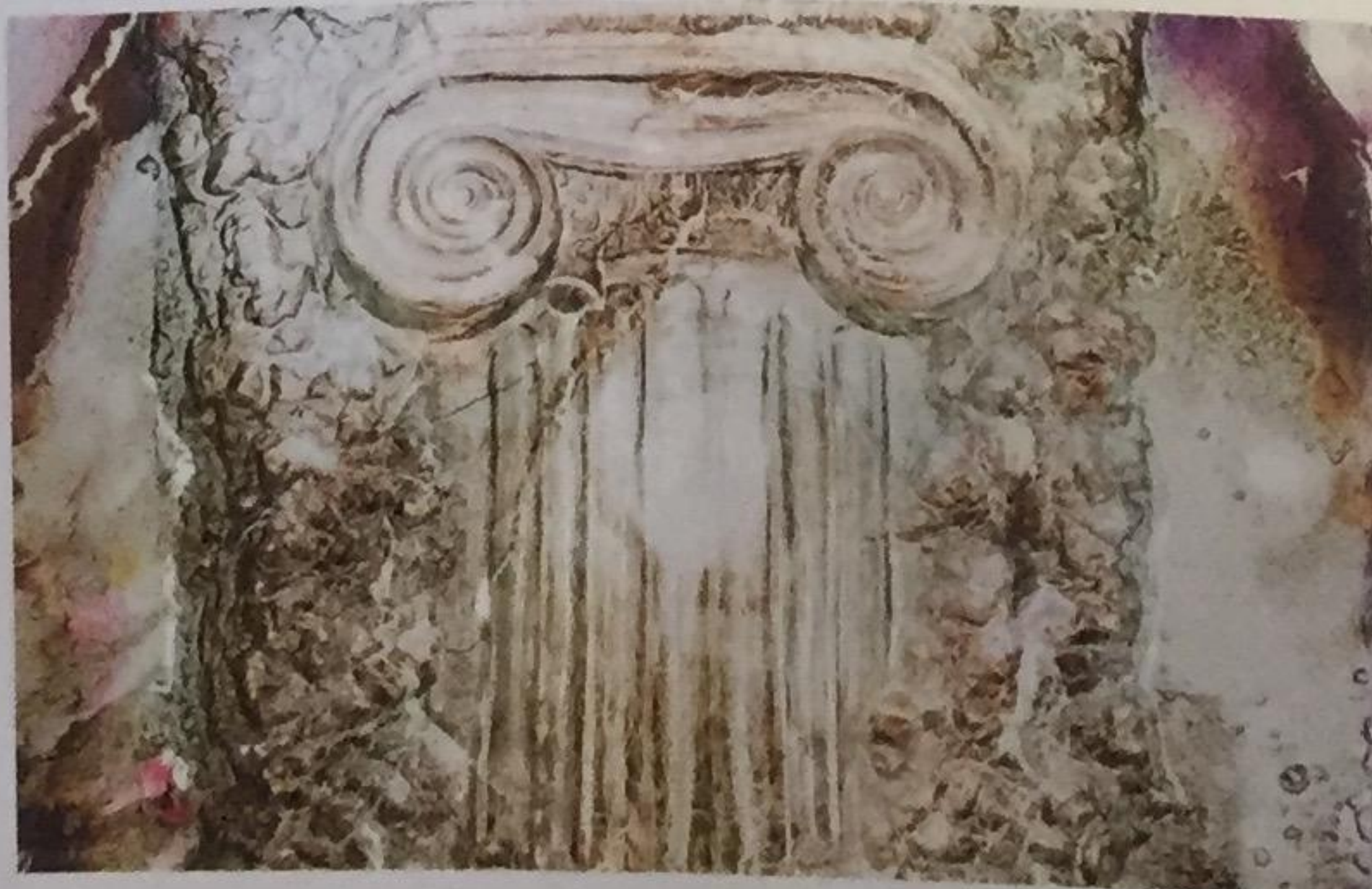
Iónsky stĺp, 2015