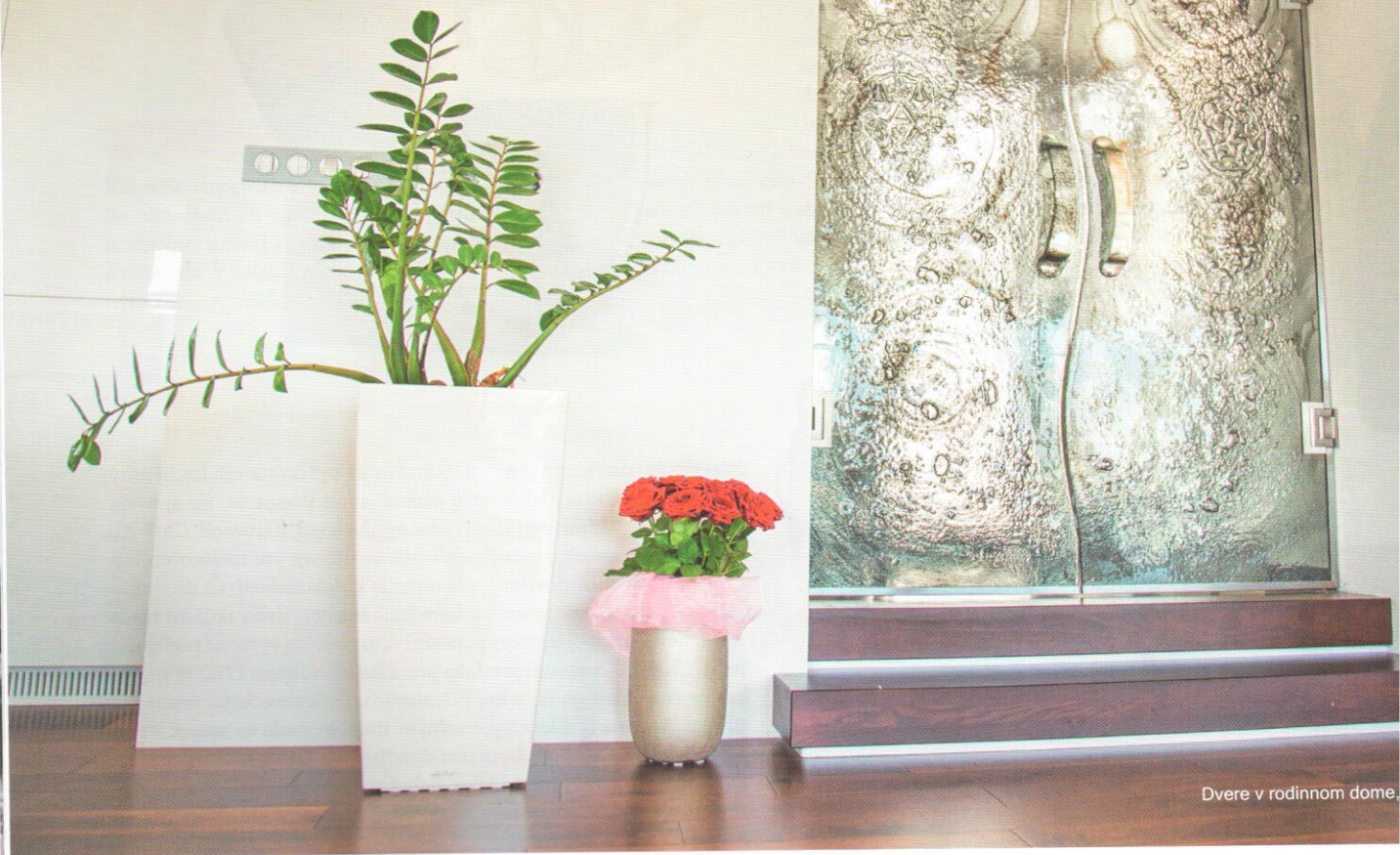
Dvere v rodinnom dome.