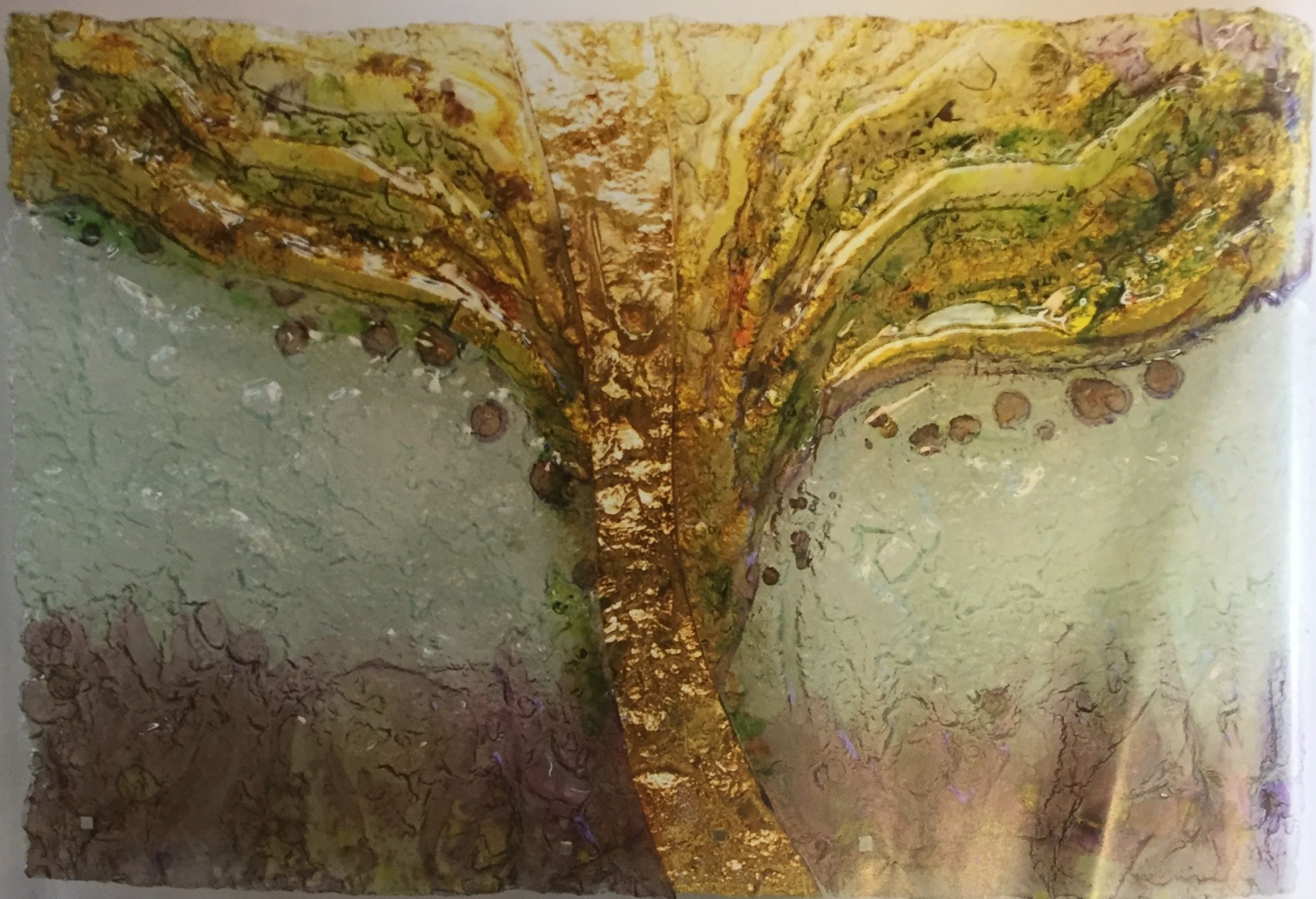
Obraz Strom života, 2014

v náznaku vypovedať či už celé príbehy, alebo ich torzá. Má schopnosť vyčariť emócie a je naozaj akýmsi najprirodzenejším „príbuzným“ svetla. Dovedna vedú vytvoriť nečakané momentky a v každej chvíli akoby sa v nich zrodilo niečo nové, čo má schopnosť pôsobiť na našu fantáziu.